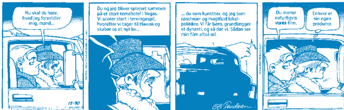
Tegning: „Doonesbury“ af Trudeau, Information 9.1.01

Vi må i vores dagligdag træffe en lang række valg – og vi står alene, når vi vælger. For vilkårene bliver som nævnt, at vores valg – frigjort fra traditionen – principielt må blive individuelle valg; valg som må være baseret på tillid til, at vi har fået de rigtige informationer samt på vores intuitive fornemmelser. Men samtidig vil der altid være en nagende tvivl om, hvorvidt valget nu var rigtigt; og dertil risiko for, at eksperterne og ekspertsystemerne tager fejl. Takket være eksperterne og ekspertsystemerne er mange af tidligere tiders risici – f.eks. risiko for sultkatastrofer