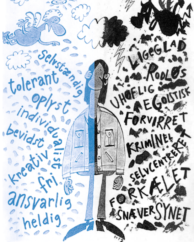
Tegning: FUPZ, Samvirke okt.97

Vi vil i det følgende søge at indkredse nogle af de samfundsmæssige forhold, som i særlig grad præger ungdomsgenerationen. Vi vil undersøge, hvad disse forhold har betydet for unges opfattelse af sig selv og deres omverden. Vi vil endvidere se på, hvad denne identitetens datomærkning betyder for de sociale sammenhænge og fællesskaber – familie, gruppe, samfund – som man indgår i. Og hvad de betyder for disse fællesskabers stabilitet og udviklingsmuligheder.